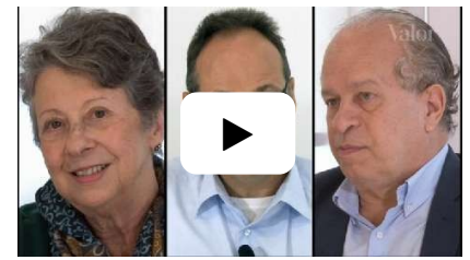
A chance e o risco de Temer 20/05/2016

Mary Robinson: Falamos sobre direitos humanos e sobre problemas do clima e isso pode ser deprimente. Esses problemas são muito sérios. Acredito que existem duas formas de olhar para isso. Um é ver o quanto isso é ruim e descrever o quanto isso é ruim. E tudo fica muito negativo, não há energia, não há oxigênio para fazer nada. O outro é ver que a situação é difícil, mas que há pessoas corajosas lutando contra isso e que podemos tentar ajudá-los. Eu sempre pego emprestada uma expressão do meu amigo arcebispo Desmond Tutu. Estivemos em um painel em Nova York, há alguns anos, com pessoas jovens, e ele fica muito entusiasmado quando está com jovens. Havia lá uma jornalista que, de forma até um pouco ríspida, perguntou a ele como se mantinha otimista. E ele respondeu: "Minha cara, não sou um otimista, sou um prisioneiro da esperança". Isso foi profundamente importante para mim. Você precisa ter esperança, que é a energia para fazer mudanças.