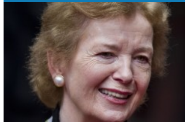
Mary Robinson: em 2050 poderão existir até 200 milhões de refugiados do clima

Em suas palestras, Mary Robinson conta que começou a se interessar cedo pela questão dos direitos humanos. Única filha em uma família católica, com dois irmãos mais velhos e dois mais novos, a mulher que se tornou a primeira presidente da Irlanda, em 1990, brinca que teve poucas alternativas a não ser aprender a defender sua própria integridade. Em 1997 assumiu o posto de alta comissária das Nações Unidas para Direitos Humanos, causa que a move. Hoje está à frente da Fundação Mary Robinson-Justiça Climática, voltada a pessoas em situações de risco, e é enviada especial da ONU para mudanças climáticas. Mary Robinson, 72 anos, veio ao Brasil a convite do Fronteiras do Pensamento e do Centro Ruth Cardoso no fim de julho. Abaixo, trechos da entrevista que concedeu ao Valor :